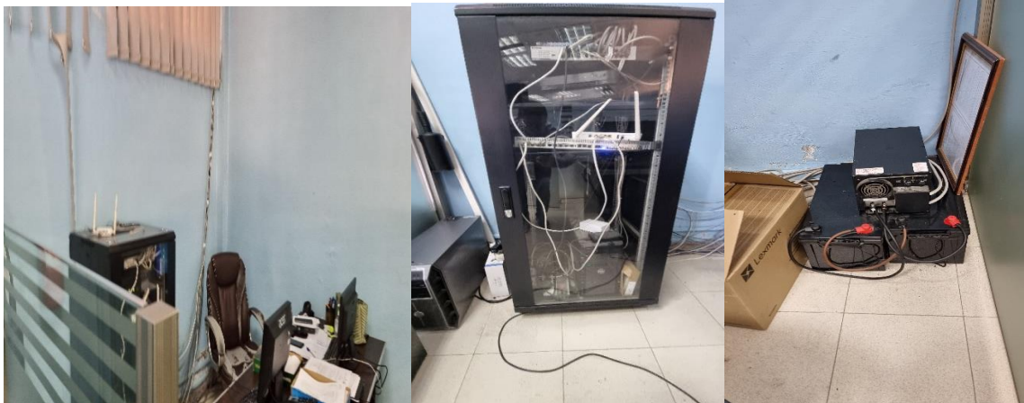
Foto nr1,nr2 dhe nr.3

1.Shërbimet e ofruara me anë të Teknologjisë së Informacionit në UKSH mbështeten në një infrastrukturë IT (rrjeti network) të amortizuar, shërbimet e ngritura mbi këtë rrjet nuk janë të sigurta dhe nuk mbështesin vazhdimësinë e punës.