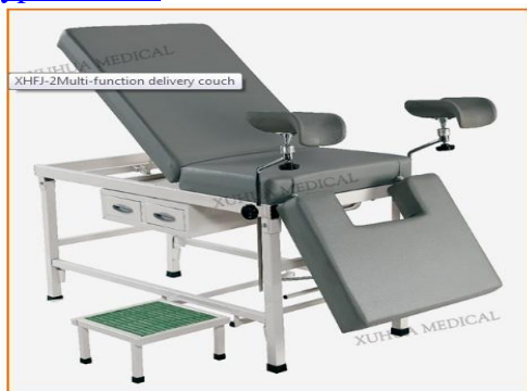
XHFJ-2Multi-function delivery couch

http://en.xuhuamedical.com/products_search_result/keyword=XHE20B&method=submit&searchType=1.html