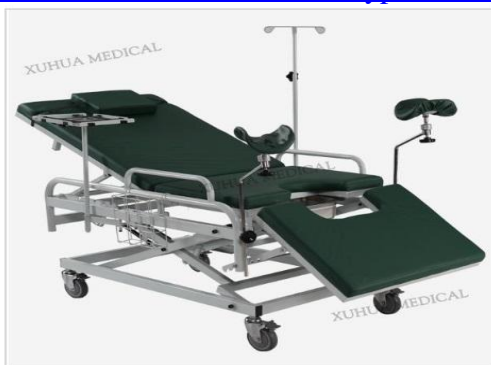
XHFJ-1 Multi-function delivery couch

http://en.xuhuamedical.com/products_search_result/keyword=XHFJ-1&method=submit&searchType=1.html