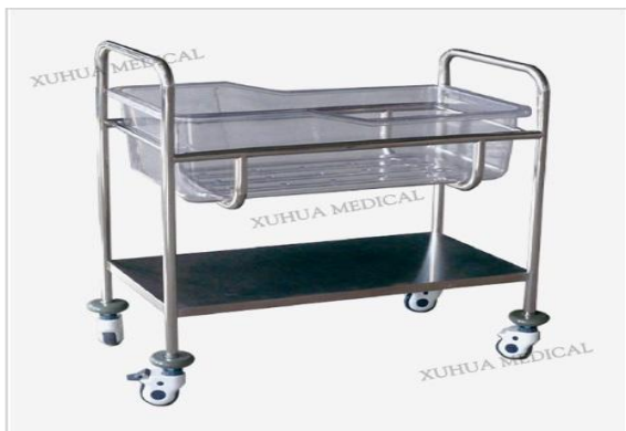
XHE20B Hospital infant bed