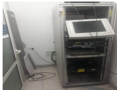
Ambientet e dhomës së serverave

Duhet të jenë të tillë që të sinjalizojnë problemet me rrymën elektrike, me ambientin fizik, sensor për rrjedhjen e ujit, sensor për parandalimin e dëmtimeve fizike të strukturës së dhomës.