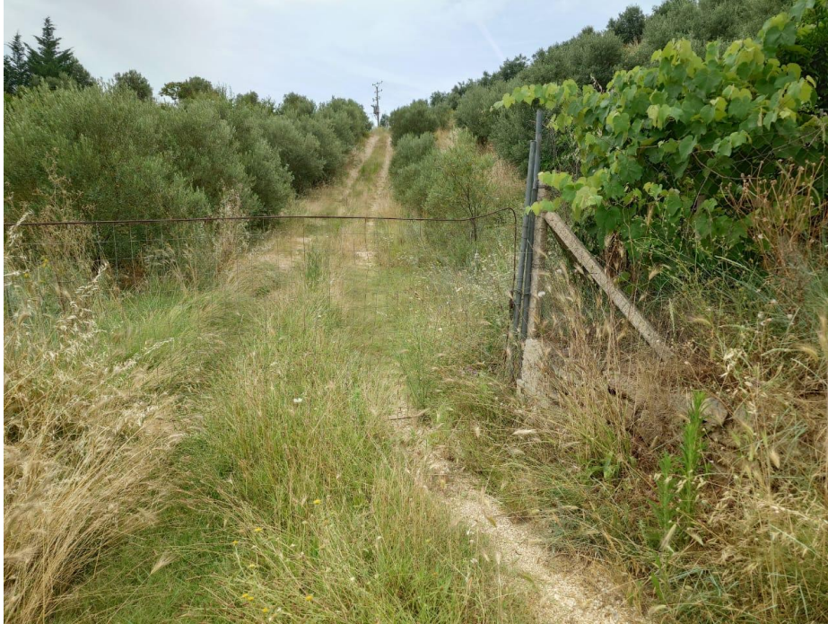
Foto e rrugës së bllokuar, e mbajtur në terren.